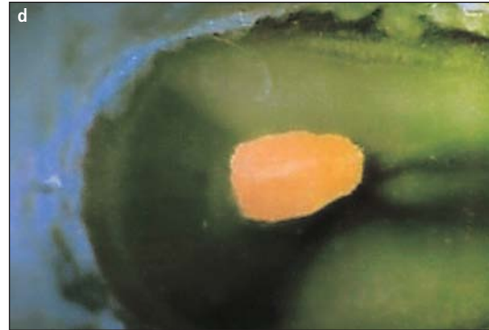
Afb. 2. a en b. Twee voorbeelden van goed geadapteerde wortelkanaalvullingen met warme verticale compactie, waarbij de warmtebron tot op 2 mm van het apicale uiteinde reikte. c en d. Twee vullingen waarbij de hittebron tot op 4 mm van het apicale uiteinde reikte.

mineerd langs de gehele lengte van de wortelkanaalvulling (Thoden van Velzen et al , 1995). Daarom wordt wel voorgesteld, indien de wortelkanaalvulling enige tijd aan het mondmilieu blootgesteld is geweest, een revisie uit te voeren voordat een coronale afsluiting wordt aangebracht (Siqueira et al , 2000). Uit klinisch retrospectief onderzoek blijkt echter dat een dergelijke rigoureuze aanpak wellicht lang niet altijd gerechtvaardigd is en enkel op aannames berust (Ricucci en Bergenholtz, 2002).